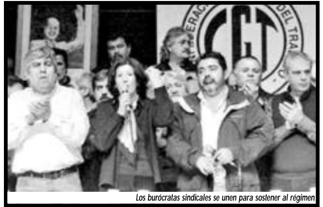
Los burócratas sindicales se unen para sostener al régimen