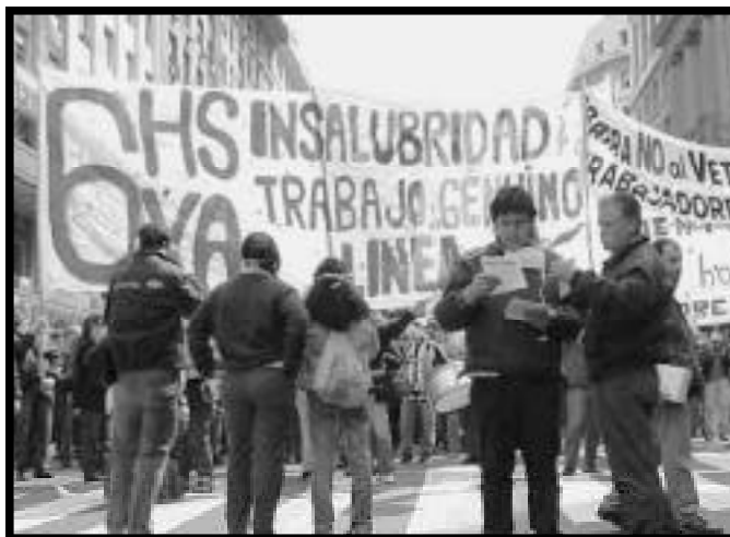
Para conquistar las 6 horas los trabajadores del Subte debieron enfrentar a la patronal, a la burocracia sindical y también a la represión policial

Bajo estas condiciones, Lucita no va poder convencer, con su campaña de